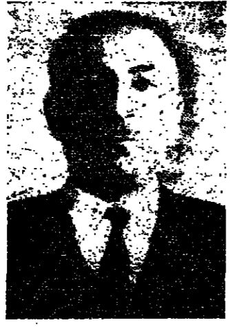
محمود شيت خطاب